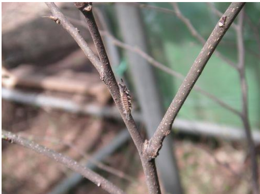
<越冬から出てきた幼虫 (2 cm) >