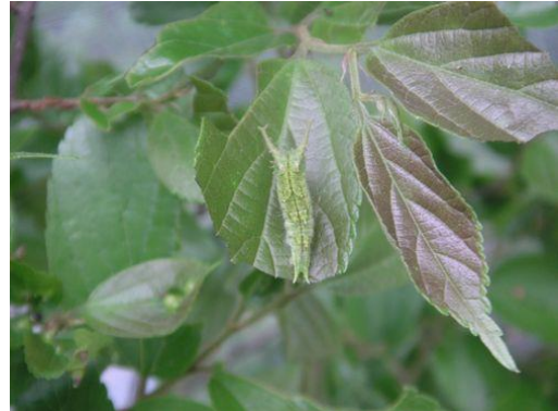
<エノキの葉を食べ脱皮すると緑色に>