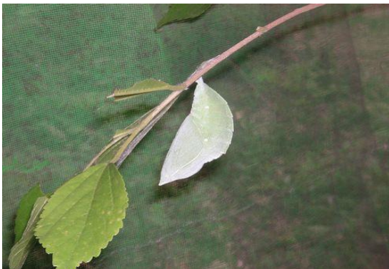
<さなぎから羽化へ>