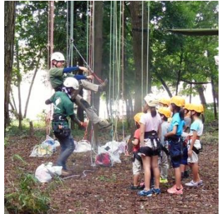
②先生の実演と説明