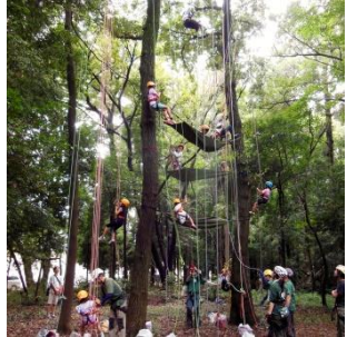
③実践 自分の力でのぼれます