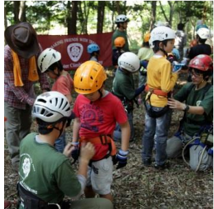
①ハーネス・ヘルメット装着