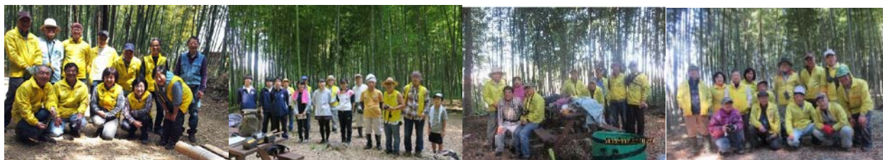
4月21日(13名) 8月10日(9名+中2名高4名) 11月9日(9名) 2月8日(13名)