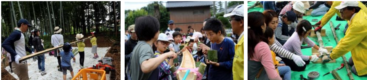
11名+大人80名、子ども89名、幼児（無料）3名