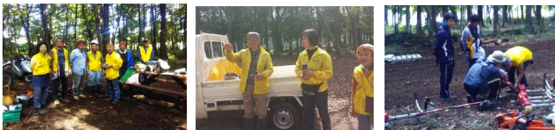
6月16日(10名) 8月31日(7名+5名) 3月22日(13名)